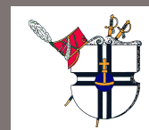
Prinzen гарде Meckenheim